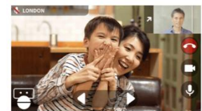
ビデオチャットロボット遠隔操作イメージ