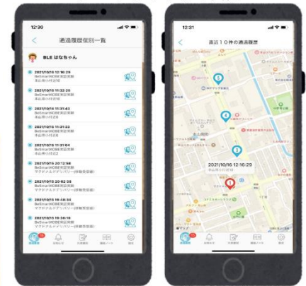
ミマモルメアプリの画面

直近10件の履歴が通過順に地図上(※)でマッピング表示されます。 ※端末によりApple Maps又はGoogle Maps(上記画像はApple Mapsの例)